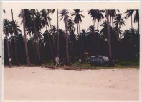
รูปที่ 1.1 การปฏิบัติภาระกิจของผู้ศึกษา