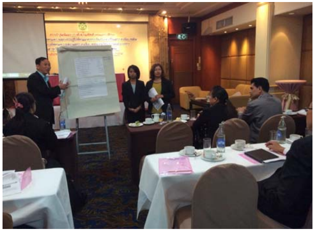
รับฟังความคิดเห็นและข้อเสนอแนะ