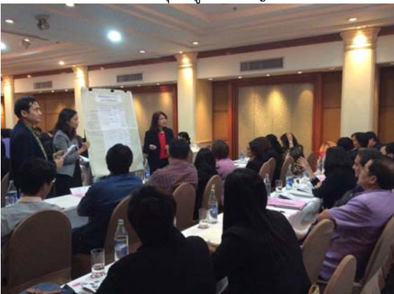
รับฟังความคิดเห็นและข้อเสนอแนะ